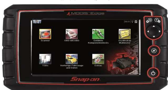
8" Touchscreen Farbbildschirm Maße: Gewicht: